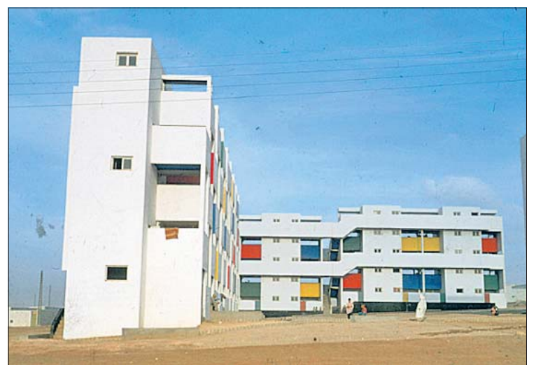
Cité Verticale, ATBAT-Afrique, Carrières Centrales, Casablanca, Morocco, 1953.

Jusqu'au 18 septembre à la galerie Schortgen, 24 rue Beaumont, L-1219 Luxembourg. Ouverte du mardi au samedi de 10 à 12.30 et de 13.30 à 18 heures.